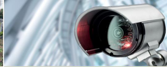
Mobiele camera's op vraag van N-VA (p. 3)