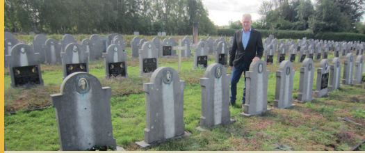
Grafzerken oud-strijders in ere hersteld (p. 2)