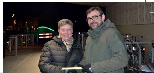
Veiligheidsactie: fietser, laat u zien! (p. 3)