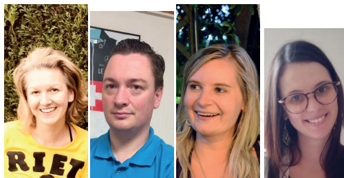
N-VA Liedekerke verwelkomt nieuwe gezichten (p. 2)