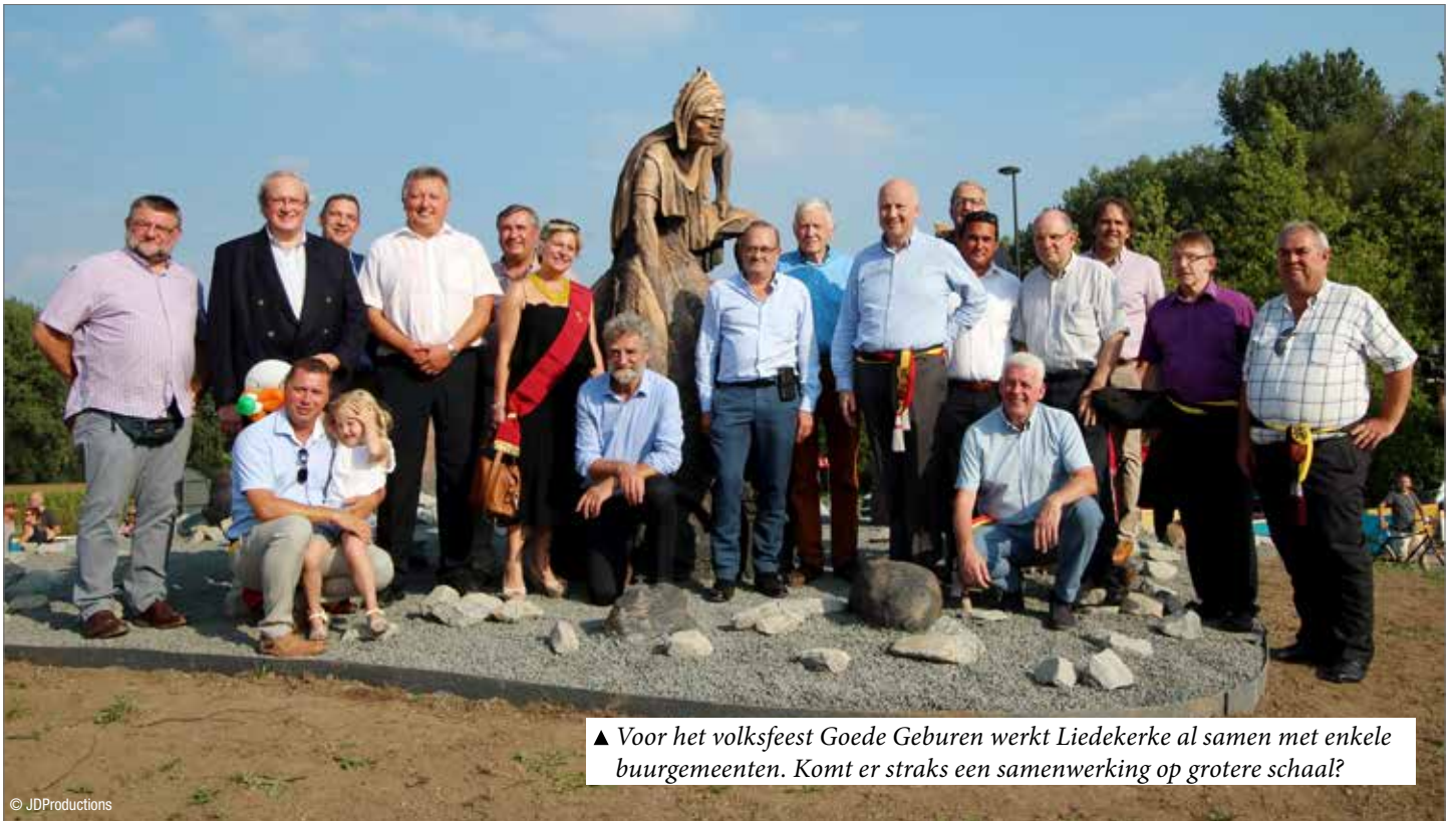
▲ Voor het volksfeest Goede Geburen werkt Liedekerke al samen met enkele buurgemeenten. Komt er straks een samenwerking op grotere schaal?