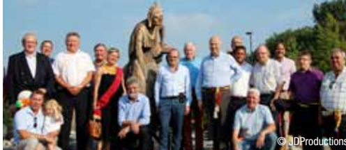
Goede Geburen voorbode van een fusie? p. 2