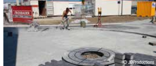
Nieuw station Liedekerke sluit loketten p. 3